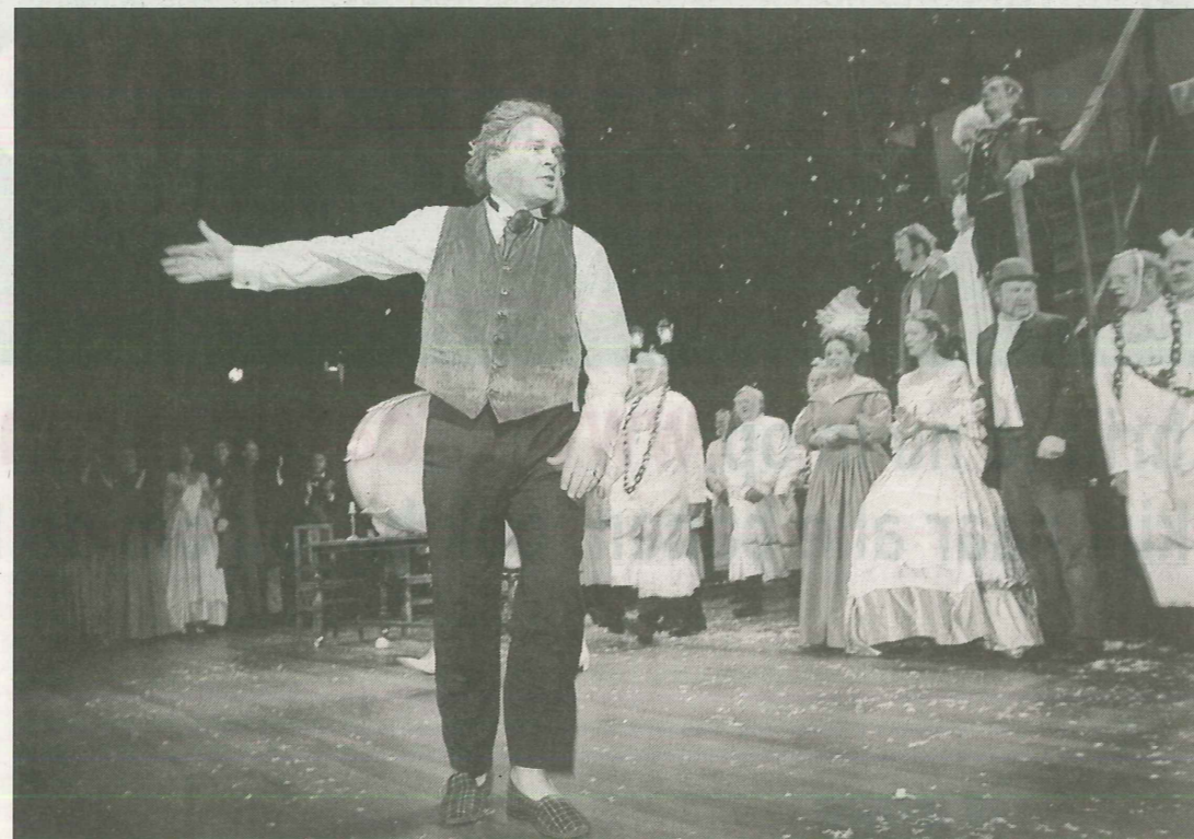
Erik van Muiswinkel na afloop

Beneden is inmiddels het slotapplaus aan de gang, waarbij het aanwezig publiek massaal uit de stoelen rijst voor een staande ovatie. Onder hen is Redmond O'Hanlon (de man met de bakkebaarden) uit de vermaarde televisieserie 'Beagle, in het kielzog